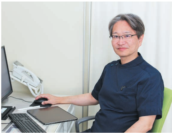
内視鏡による胃・大腸検査で疾患の早期発見と治療に努めている