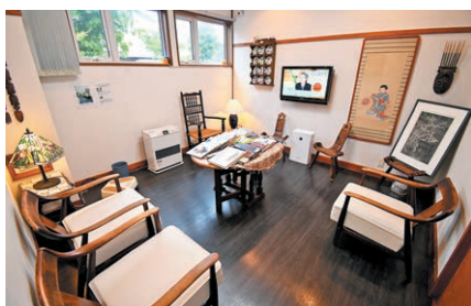
レトロな雰囲気落ち着ける第2待合室(1F)