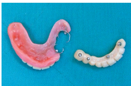
インプラント治療で安定しにくい片側歯が無い義歯から卒業