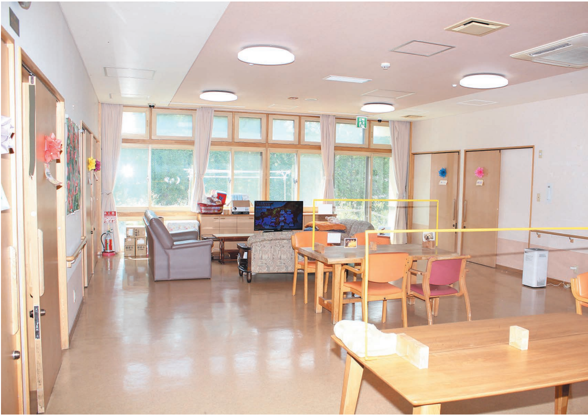
採光が良く、清潔感のある共用スペース