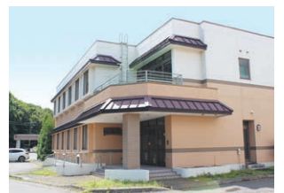
グループホーム ハーモニー