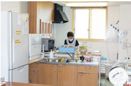
食事は毎食、入居者から見える台所で作っている

ち込めるため、プライベートな空間でゆったりと過ごすことができる。広々としたホールは食事やティータイム、テレビや趣味を楽しめる空間。職員と一緒に洗濯物を畳むなど、できる人ができる範囲で家事に参加。家庭同様に役割を担うことで、心理的な安定と充足感も得られる。